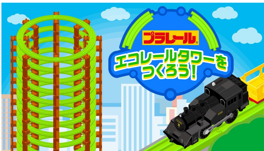
「プラレール エコレールタワーをつくろう！」 タイトル画面