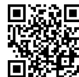
アプリダウンロード

Apple、Apple のロゴ、iPhone、iPad、iPod touch は、米国もしくはその他の国や地域における Apple Inc.の商標です。 iPhone の商標は、アイホン株式会社のライセンスにもとづき使用されています。App Store は、Apple Inc.のサービスマークです。 iOS は米国その他の国々における Cisco の商標または登録商標であり、ライセンス許諾を受けて使用されています。 Android、Google Play、Google Play ロゴは Google LLC の商標です。