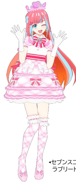
セブンスコーデラブリードレス