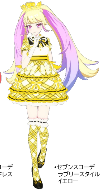
セブンスコーデラブリースタイルイエロー