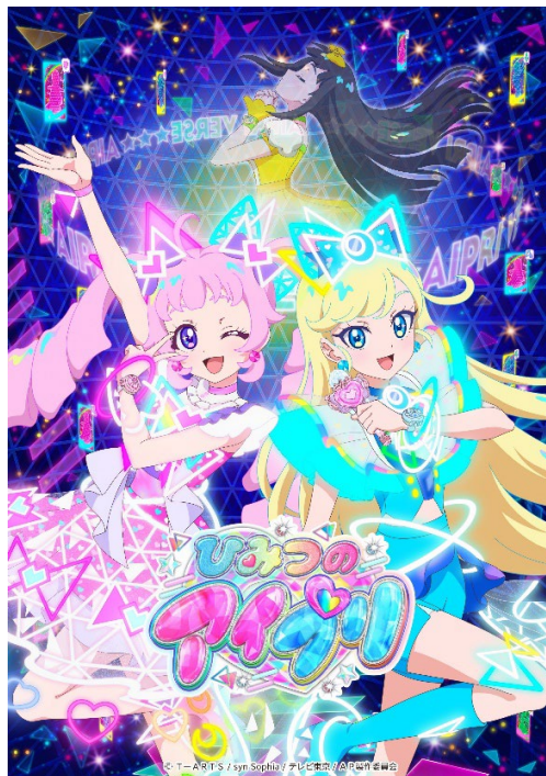
『ひみつのアイプリ』キービジュアル

テレビ東京系列6局ネットでアニメ放送開始、合わせてアミューズメントゲームが稼動、玩具(発売元:株式会社タカラトミー)も展開開始いたします。