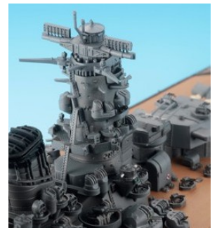
※艦橋部(左右舷灯が点灯)