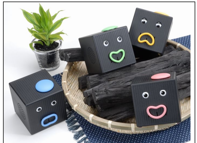
炭色パワーで『笑集(しょうしゅう)』効果！