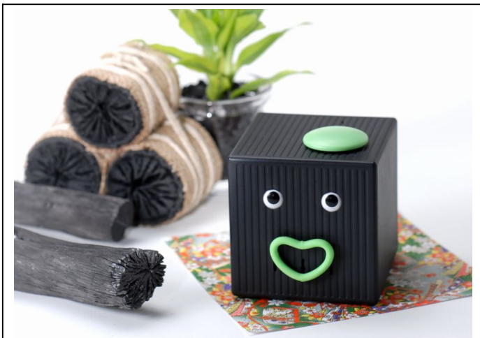
お部屋のインテリアとして・・・。