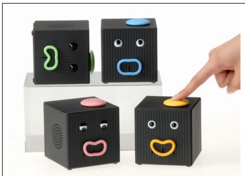
『クロックマン』全4タイプ