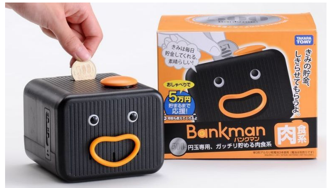
バンクマン 肉食系(500円硬貨専用)