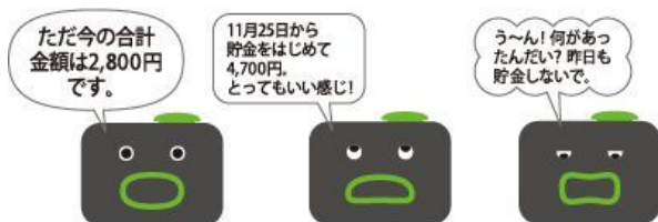
バンクマン 草食系(グリーン/セルフ例)

『バンクマン』公式ホームページ： http://www.takaratomy.co.jp/products/bankman/