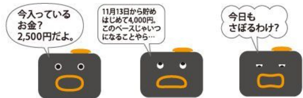
バンクマン 肉食系(オレンジ/セルフ例)