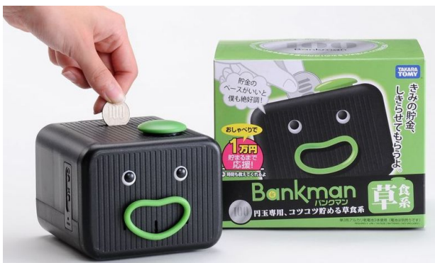
バンクマン 草食系(100円硬貨専用)