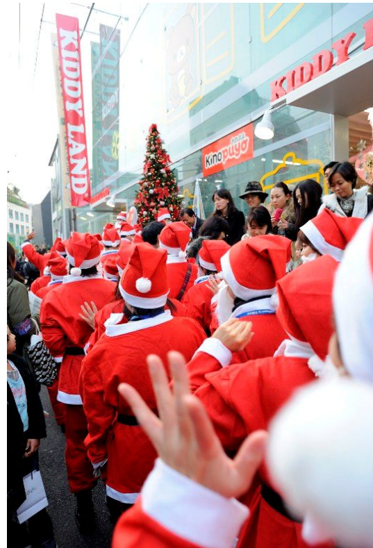
いよいよサンタが到着！