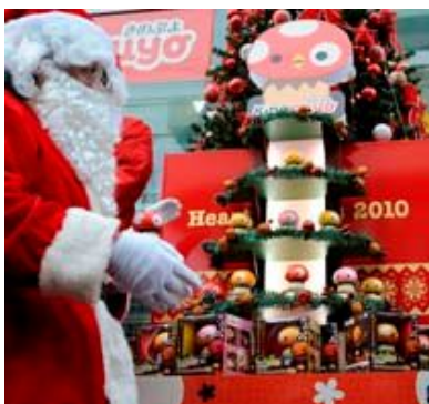
「きのぷよ」ツリーが完成!

「きのぷよ」は、振動を感知するとセンサーが反応し、やわらかい体を左右に伸縮しながら、きのこの傘部分と切り株の形をした台座部分がやさしく光るライトです。玄関や、ベッドサイド、廊下など、ちょっと手元や足元の明かりが欲しいときの便利なライトとして、また、指先で“トントン”と振動を与えると反応するコミュニケーションライトとして、子どもから大人まで、今大人気の“きのこ”をモチーフにした「きのぷよ」の小さな光は、家庭やお店など様々なシーンで、彩りのある生活空間を演出します。