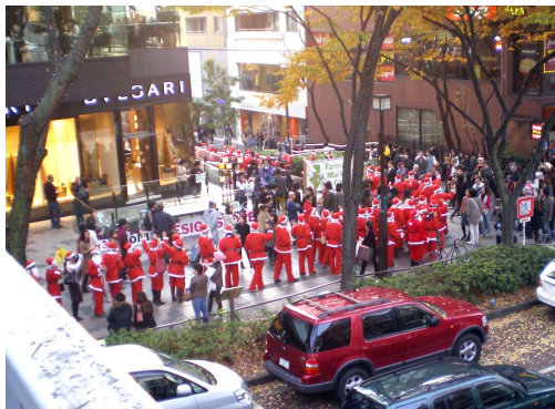
課外購読「サンタクロース行進」