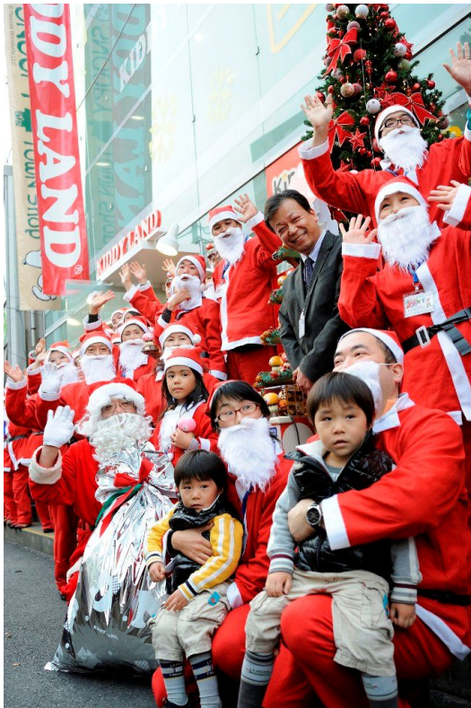
笑顔いっぱいのお出迎え