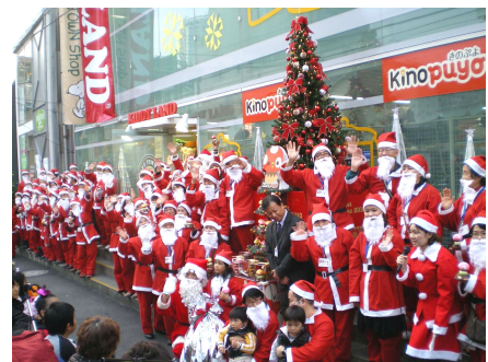
店頭に77人のサンタが大集合！

世の中に明るい話題が求められる時代だからこそ、子どもたちが毎年楽しみにしているクリスマスに夢を届けていきたい、サンタクロースと出会う人たちにとって、笑顔に包まれるひとときを過ごしてもらいたいと願っています。株式会社タカラトミーグループは、これからも、夢や感動が膨らみ、友達や家族とのコミュニケーションが次から次へと広がる、良質なおもちゃやコンテンツを創造し、世界中の子どもから大人まで多くの人たちに提供してまいります。