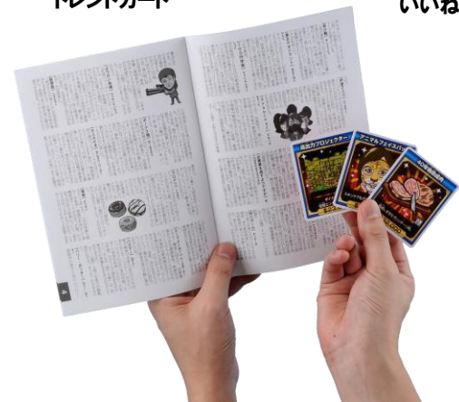
新語を楽しく解説