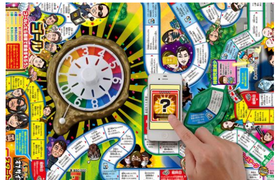
WEB連動でノミネートワード発表後に反映！

「人生ゲーム オブザイヤーII」は、人生ゲームをベースとし増税や待機児童問題などの社会的な話題や、毒舌タレント、作曲家、動画クリエイターといった注目の職業など、2014年の話題を詰め込んだ盤ゲームです。