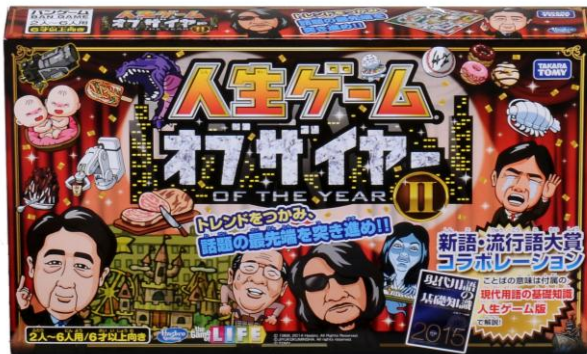
「人生ゲーム オブザイヤーII」

株式会社タカラトミー(代表取締役社長:富山幹太郎/所在地:東京都葛飾区)は、ロングセラー盤ゲーム「人生ゲーム」の最新作として、2014年の「新語・流行語大賞」(※1)とコラボレーションした「人生ゲーム オブザイヤーII」(希望小売価格3,800円/税抜き)を、2014年11月20日(木)から、全国の玩具専門店、百貨店・量販店の玩具売場、インターネットショップ、タカラトミー公式ショッピングサイト「タカラトミーモール」 http://takaratomy.com/shop/ 等にて発売致します。