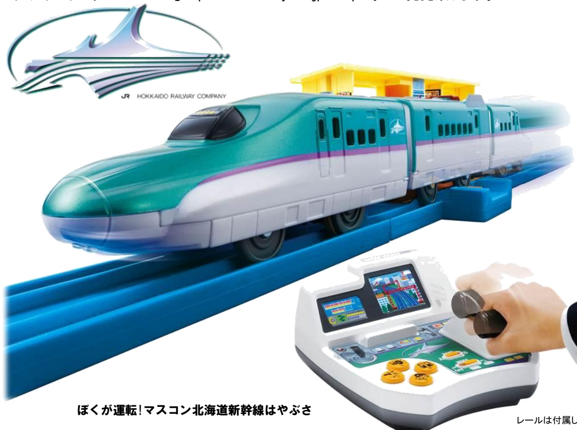
ぼくが運転! マスコン北海道新幹線はやぶさ

株式会社タカラトミー(代表取締役社長:H.G.メイ/所在地:東京都葛飾区)は、2016年3月26日に開業する北海道新幹線 1) のプラレール 2) を運転士のようにコントロールできる鉄道玩具「ぼくが運転！マスコン北海道新幹線はやぶさ」(希望小売価格:6,500円/税抜き)を、2016年4月28日(木)から全国の玩具専門店、百貨店・量販店の玩具売場、インターネットショップ、プラレール専門店「プラレールショップ」、タカラトミー公式ショッピングサイト「タカラトミーモール」 http://takaratomy.com/jp/shop/ 等にて発売致します。