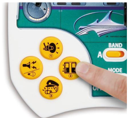
ボタンを押すと様々な音声が楽しめます