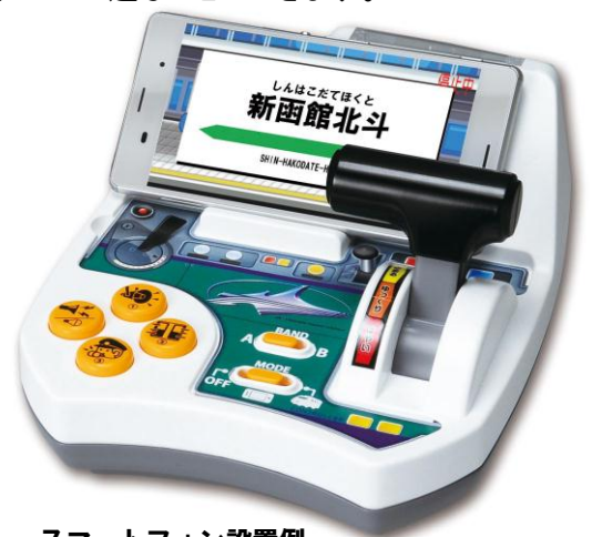
スマートフォン設置例