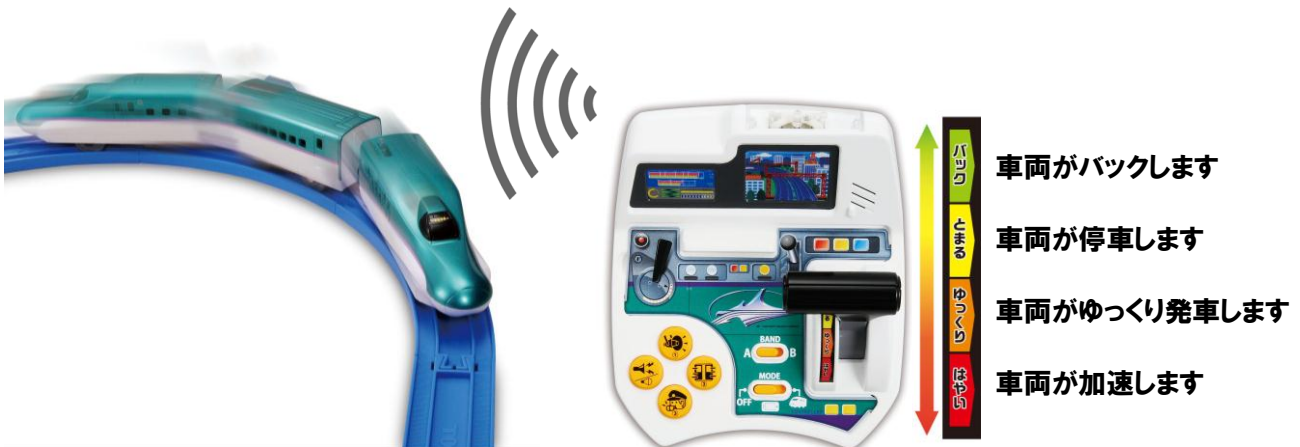
「ぼくが運転! マスコン北海道新幹線はやぶさ」操作イメージ

運転士が運転台のレバーを使って実際の車両を運転するように、子どもたちも「操縦レバー」を使って、車両を操作することができます。