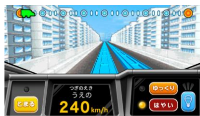
アプリ「マスコン」画面一例