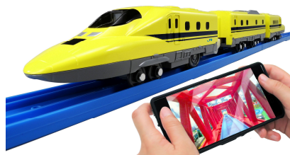
JR 西日本商品化許諾済 「プラレール」は株式会社タカラトミーの登録商標です。

イノベティブ・トイ部門大賞: プラレール 「スマホで運転! ダブルカメラドクターイエロー」