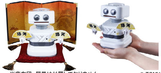
※座布団、屏風は付属していません。

2020年まで毎日ギャグで家族を笑顔にしてくれるコミュニケーション性と、電波時計内蔵という実用性を評価していただきました。