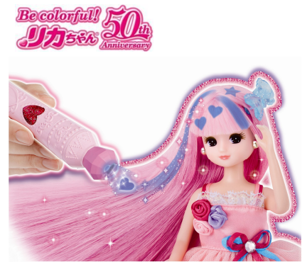
特別賞：「リカちゃん」

©Hiro Morita, BBBProject, TV TOKYO ©TOMY