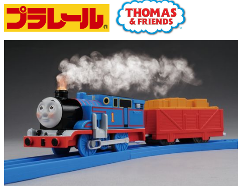
イノベティブ・Toy部門大賞： 「プラレール 蒸気がシュツシュツ！トーマスセット」