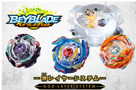
ボーイズ・Toy部門大賞：ゴッド 「ベイブレードバースト新シリーズ(神レイヤーシリーズ)」

タカラトミーグループ(本社：株式会社タカラトミー／代表取締役社長：H.G.メイ/所在地：東京都葛飾区)は、一般社団法人日本玩具協会が主催する「日本おもちゃ大賞2017」(※1)において、7部門中、2部門で大賞、4部門で優秀賞を受賞いたしました。大賞商品は、ボーイズ・Toy部門にて次世代ベゴマ「ベイブレードバースト新シリーズ」、イノベティブ・Toy部門にて、本当に給水できる！熱くない、リアルな蒸気が出る「プラレール 蒸気がシュツシュツ！トーマスセット」、の2商品です。また、今年誕生 50 周年を迎えた「リカちゃん」が特別賞を受賞いたしました。