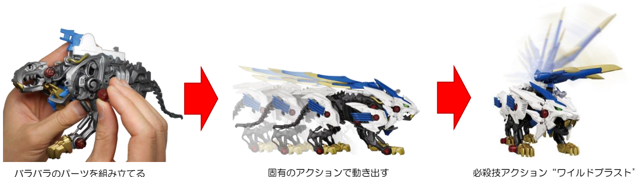
バラバラのパーツを組み立てる