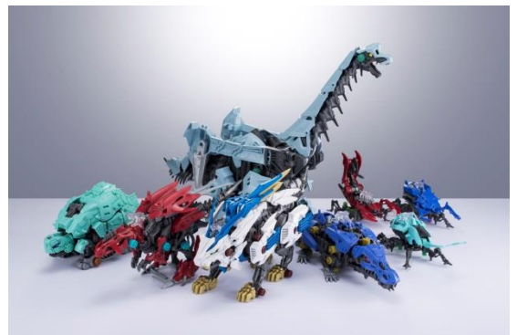
「ゾイドワイルド」商品

玩具、テレビアニメ、まんが、ゲーム、アプリなどのメディアミックス展開もさらに強化された。