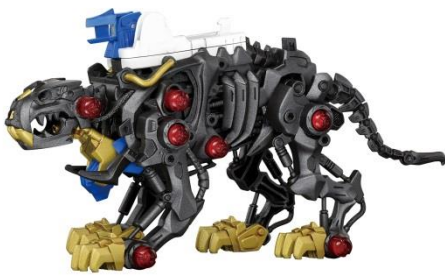
リアリティを追及した骨格デザイン