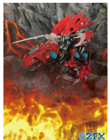
専用アプリで作成したオリジナル動画(イメージ)