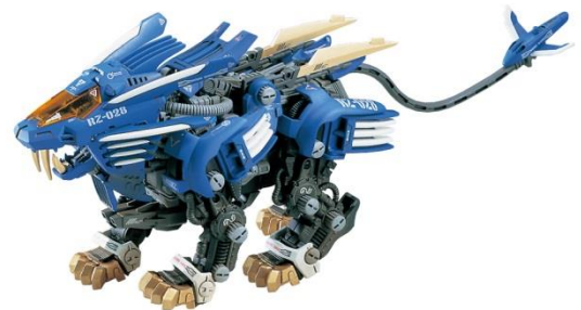
「フレードライガー」 (2000年発売 当時価格2200円)

第1期のモデルをベースにしながらアニメとも連動した玩具は、第1期に引き続き当時の子どもたちの間で人気となった。1999年から2006年の間に4つのテレビアニメシリーズが放送され、日本国内と海外展開を合わせて、2500万体制以上が出荷された。