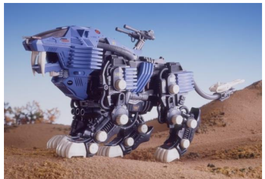
「シールドライガー」 (1987年発売 当時価格1980円)

当時のプラキットは接着剤を使用するものが主流だったが、ゾイドは子どもが組み立てやすいように接着剤を使わなくてもゴムキャップで組み立てられる方式を採用した。その簡単な組み立てと、ゼンマイやモーターを動力としてリアルに歩くアクションと秀逸なデザインが当時の子どもたちの間で絶大な人気を博した。日本国内で1900万体制以上が出荷された。