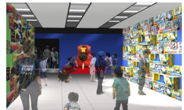
新旧のパッケージ展示(イメージ)

プラレールの歴史を商品展示と共にふりかえるコーナー、新旧のプラレール車両やパッケージを比較して楽しめるコーナーなど、親子で楽しみながらプラレールの歴史に触れられる展示を行います。