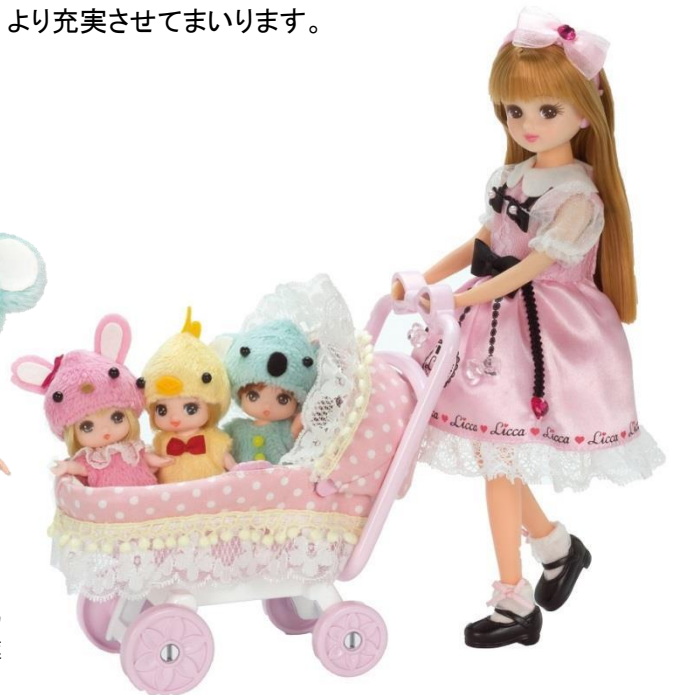
リカちゃんみつごの赤ちゃん