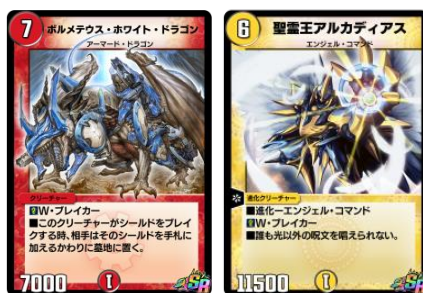
懐かしのレジェンド級カード (アプリ仕様) 左 : 「ボルメテウス・ホワイト・ドラゴン」 右 : 「聖霊王アルカディアス」