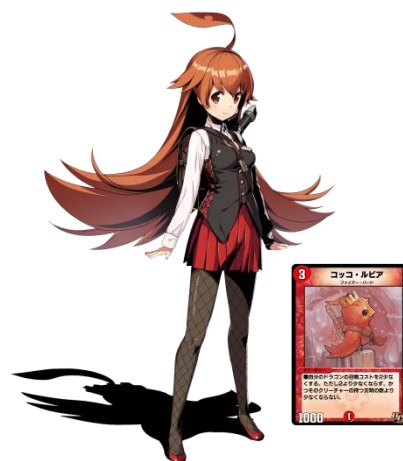
ゲームナビゲーター「コッコ・ルピコ」 (CV.指出毬亜)