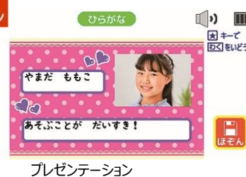
プレゼンテーション

※作成したデータをJPEGで保存でき、フォルダに格納もできます。別売りのマイクロSDへの保存も可能です。