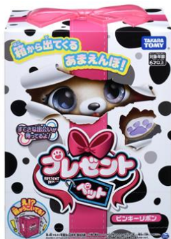
「プレゼントペット」外箱 (ピンキーリボン)