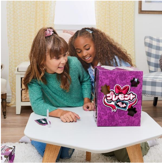
プレゼントボックスが破れていく様子

「プレゼントペット」は、ユーザーがプレゼントボックスのタグを引くと、プレゼントボックスがひとりでのガタガタゆれながら破れ、やがて 仔犬が中から自ら出てくるといふ、“家族との新しい出会い” とお世話やゲーム、おしゃべり遊びを通してコミュニケーションを楽しむことができる新感覚のペット玩具です。