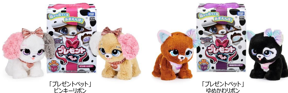
「プレゼントペット」 ピンキーリボン