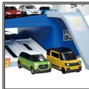
2台同時発射できるシューター