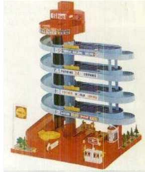
1972年 「トミカビルデラックス」

立体駐車場をイメージし、「トミカ」をスロープで走らせたり、駐車場に飾ったり、給油ごっこをしたりと、「トミカ」遊びでの想像の世界を広げる商品として登場。エレベーターは手動で1台ずつ屋上に運ぶ仕組み