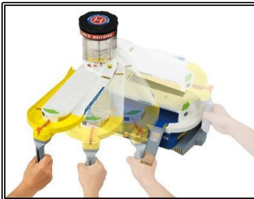
2つのモードが楽しめる簡単変形ギミック

「ダブルアクショントミカビル」最大の特徴は、2つのモードが楽しめる変形ギミックです。パーキングエリアの上2段がスライドオープンし、「コンパクトモード」から「ダイナミックモード」に変形します。モードによってエレベーターの出口が変わり、レイアウトやコースの変化を楽しめます。また、エレベーターは電動でも手動でも遊ぶことができ、「トミカ」が上部に上がっていく様子を色んな角度から眺めて楽しめるよう、透明パーツを採用しました。さらに、パーキングスペースには「トミカ」を最大30台駐車することができ、自由に並べて遊んだり、お片付けにもご活用いただけます。その他にも、「トミカ」が飛び出すシューターやノズルが動く給油スタンドなど、想像力を広げる様々な情景を散りばめ、自由なストーリーで自分だけの街を創造しながら遊んでいただけます。