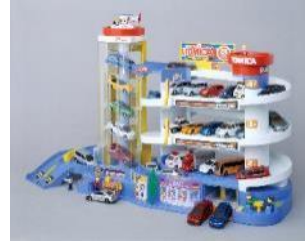
2010年 「スーパーオートトミカビル」

「トミカビル」発売の翌年に登場。通常の「トミカビル」から2フロア増えて5階建てになりレベーターで「トミカ」を一気に屋上まで運べるようになった、まさに“デラックス”なビル。