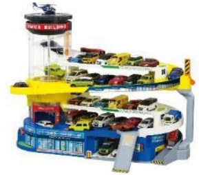
2020年 「ダブルアクショントミカビル」

「トミカ」40周年で大幅リニューアル。最大5台の「トミカ」が同時に乗る電動のスパイラルエレベーターを採用。電動・手動どちらでも遊ぶことができ、「トミカ」を自動で走らせ続けたり、「トミカワールド」の一部と連結できる