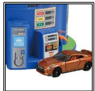
給油などのごっこ遊び