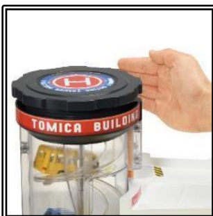
電動・手動の切り替え可能なエレベーター

「ダブルアクショントミカビル」最大の特徴は、2つのモードが楽しめる変形ギミックです。パーキングエリアの上2段がスライドオープンし、「コンパクトモード」から「ダイナミックモード」に変形します。モードによってエレベーターの出口が変わり、レイアウトやコースの変化を楽しめます。また、エレベーターは電動でも手動でも遊ぶことができ、「トミカ」が上部に上がっていく様子を色んな角度から眺めて楽しめるよう、透明パーツを採用しました。さらに、パーキングスペースには「トミカ」を最大30台駐車することができ、自由に並べて遊んだり、お片付けにもご活用いただけます。その他にも、「トミカ」が飛び出すシューターやノズルが動く給油スタンドなど、想像力を広げる様々な情景を散りばめ、自由なストーリーで自分だけの街を創造しながら遊んでいただけます。