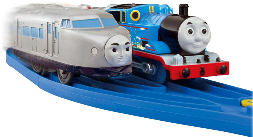
プラレール「きかんしゃトーマス ケンジとトーマスのおいかけっこセット」セット内容の一部(左から超特急のケンジ、トーマス)

株式会社タカラトミー(代表取締役社長:小島一洋/所在地:東京都葛飾区)は、鉄道玩具「プラレール」トーマスシリーズの新商品として、映画『きかんしゃトーマス』最新作に登場する新キャラクター「超特急のケンジ」がセットになったプラレール「きかんしゃトーマス ケンジとトーマスのおいかけっこセット」(希望小売価格 6,600円/税込)を2021年3月25日(木)から全国の玩具専門店、百貨店・量販店の玩具売場、インターネットショップ、プラレール専門店「プラレールショップ」、タカラトミー公式 ショッピングサイト「タカラトミーモール」 takaratomy mall.jp 等にて発売いたします。