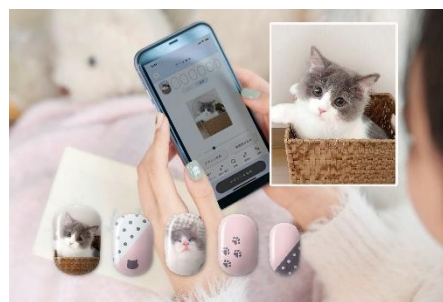
作例：ねこの写真をプリント