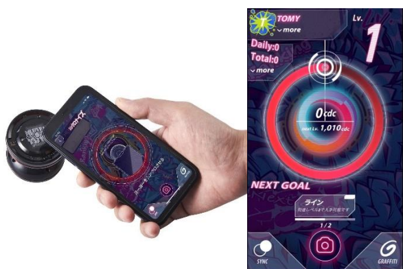
ヨーヨーをスマホにかざして専用ARアプリとシンクロ

アプリは、“ストリートカルチャー”×“サイバーパンク”のエッジを効かせた世界観で、没入感のあるプレイを体感できます。