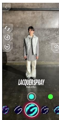
「グラフィックス」を選択して、プレイ動画を撮影・保存