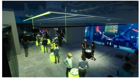
「トレーニングスタジアム」を配置した店内 巨大スクリーン（右）とアニメコーナー（奥）も設置