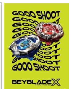
オリジナルステッカーは4種のうち1枚をランダムで配布