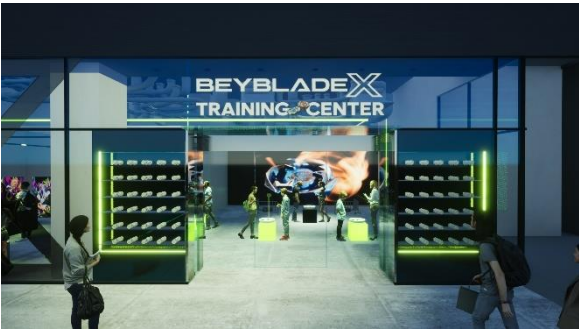
インフィニティミラーを活用したベイブレード展示