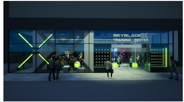
夜はグリーンライトが際立ち、よりスタイリッシュな雰囲気に