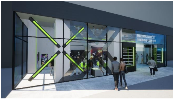
『BEYBLADE X』をイメージしたブラック&グリーンを基調とした空間