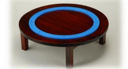
「ちゃぶ台」の上で遊べるサイズで設計されたレール

日本でこれまでに発売された商品の種類： 累計1,962種類 ※2023年12月現在