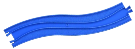
新開発の「S字レール」