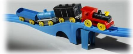
「プラスチック汽車・レールセット」(1959年)

今後も、身近であり憧れでもある“鉄道”をテーマに、子どもたちが社会を学び、創造力を養うなどの子どもたちの成長を促し、また親子のコミュニケーションを育むブランドとして展開してまいります。