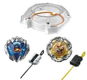
UX-04 バトルエントリーセットU 希望小売価格6,050円(税込) (2024年4月27日(土) 発売予定)