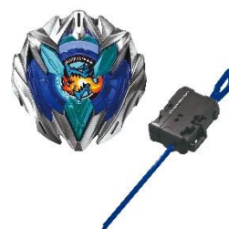
UX-01 スターター ドランバスター1-60A 希望小売価格：1,980円(税込)

『BEYBLADE X』では新フォーマットを採用し、「一撃」「叩きつけ」「遠心力」など個性特化型ベイブレードを2024年3月30日(土)から新発売します。ベイブレード(コマ)とランチャーがセットになったスターター、ベイブレード(コマ)とランチャー、スタジアムがセットになったバトルエントリーセットなどを展開します。