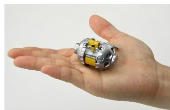
両輪、カメラ、スタビライザーが可動し、両輪は「バタフライ走行」を楽しめます。