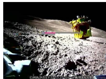
実際のSORA-Qが撮影・送信した月面画像

なお、本商品は宇宙航空の魅力を上での生活へ届けるためのブランド『JAXA LABEL DESIGN』 （※3） 付与商品として発売します。