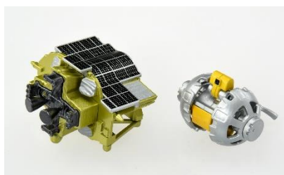
SLIM と SORA-Q