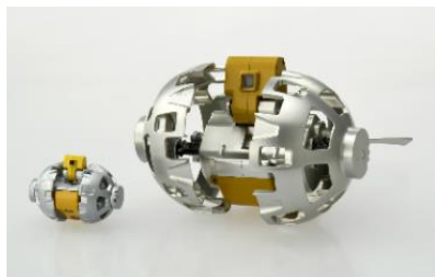
左：SORA-Q (トミカプレミアム) 右：SORA-Q 動作検証モデル