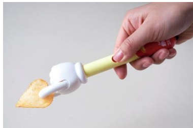
1)対象物破損防止クラッチ機構

本体の指先が机や床などに直接付かないように、手首にあたる部分にスタンドが設けられています。これにより衛生的に使用することができます。