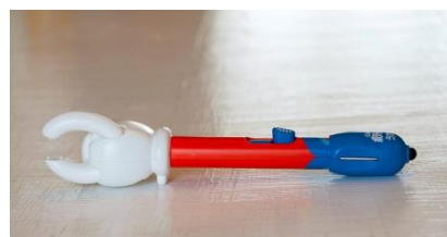
3)指先机上非接触機構

スマートフォンやタブレットを見ながら、読書やゲームをしながら…、生活の様々なシーンで手の汚れを気にせず気軽にポテトチップスが食べられる新デバイス。『スマートポテトチップス』が、現代人のモバイルライフをスマートにサポートします。