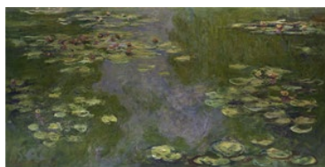
Water Lilies, 1919. Claude Monet. The Walter H. and Leonore Annenberg Collection, Gift of Walter H. and Leonore Annenberg, 1998, Bequest of Walter H. Annenberg, 2002

睡蓮 1919年 クロード・モネ The Walter H. and Leonore Annenbergコレクション、 Walter H. and Leonore Annenberg寄贈、 Walter H. Annenberg遺贈、2002年