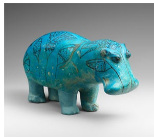
Hippopotamus ("William"), ca. 1961–1878 B.C. From Egypt. Gift of Edward S. Harkness, 1917

カバの像 紀元前1981–前1885年頃 中王国、第12王期初期 Edward S. Harkness 寄贈、1917年