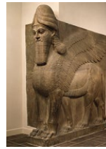
Human-headed winged lion ( lamassu ), ca. 883–859 B.C. Assyrian. Gift of John D. Rockefeller Jr., 1932

人頭有翼獅子像 紀元前883–前859年頃 新アッシリア時代 John D. Rockefeller Jr. 寄贈、1932年