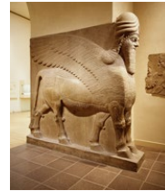
Human-headed winged bull ( lamassu ), ca. 883–859 B.C. Assyrian. Gift of John D. Rockefeller Jr., 1932

人頭有翼獅子像 紀元前883–前859年頃 新アッシリア時代 John D. Rockefeller Jr. 寄贈、1932年