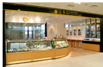
↑日本で唯一のはちみつ&メープル専門洋菓子店「QBG」の外観(ecute 品川店)