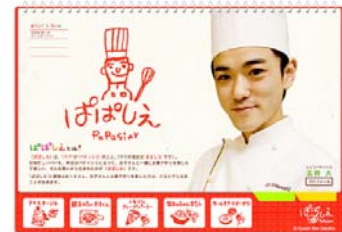
↑クッキングサイト「ぱぱしえ」イメージ