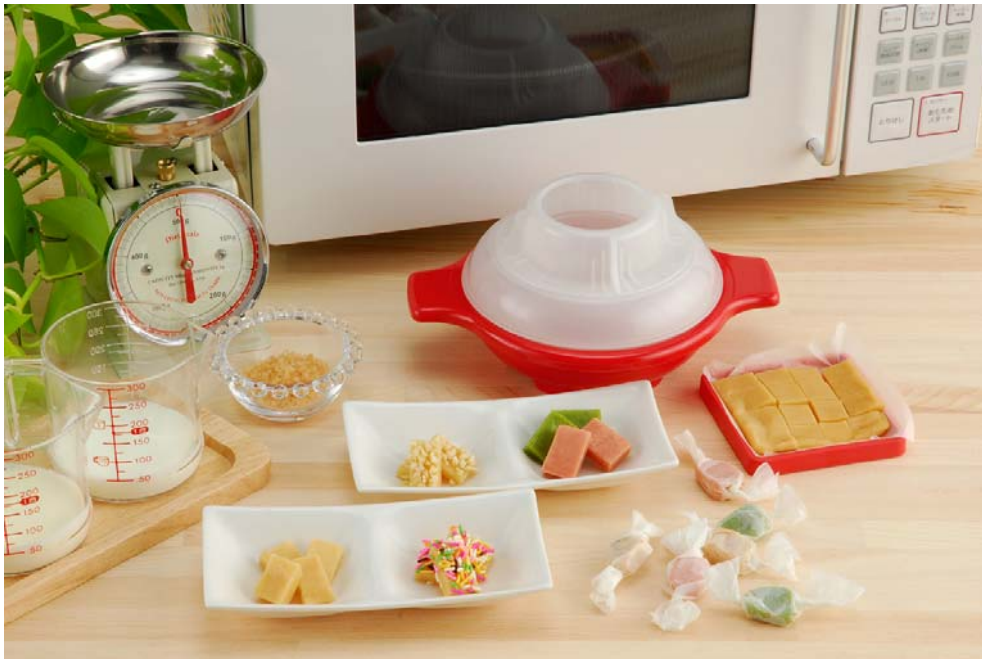
「生キャラメルポット」(税込 3,129円) と 調理例

<報道各位から本件に関するお問い合わせ先> 株式会社タカラトミー 広報チーム TEL 03-5654-1280 FAX 03-5654-1380