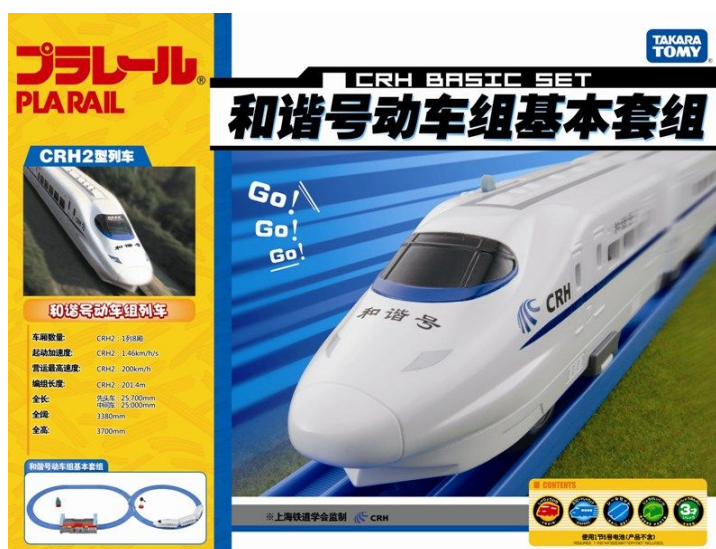
プラレール「CRH2型 和諧号ベーシックセット」パッケージ