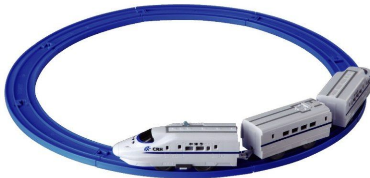
プラレール「CRH2型 和諧号スタートセット」商品内容

(C) 上海鉄道学会監制 CRH (C)TOMY 「プラレール」は株式会社タカラトミーの登録商標です。