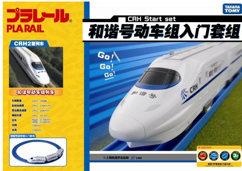
プラレール「CRH2型 和諧号スタートセット」パッケージ