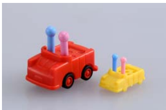
チャレンジボード用チョコQと自動車コマ