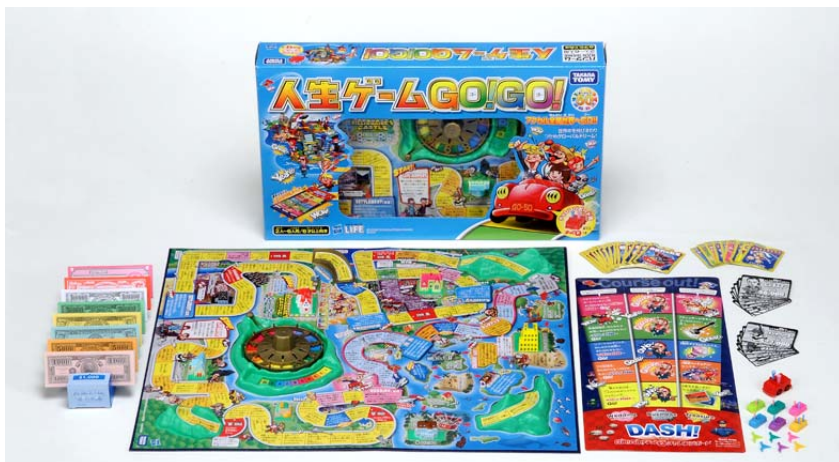
「人生ゲーム GO!GO!」(税込3,990円)