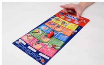
「GO!GO!チョコQチャレンジボード」の使用イメージ