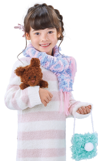
『モコモジオリーナ』

「モコモジオリーナ」は、穴の開いたパンチカードを差し込むだけで、通常は複雑な作業が必要な文字織りや模様織りが、誰でも簡単に行えるようになったはた織り機です。普遍的な人気のある織り機を、文字織りが出来るよう進化させることで、オリジナルの小物をデザインする楽しさをさらに広げました。