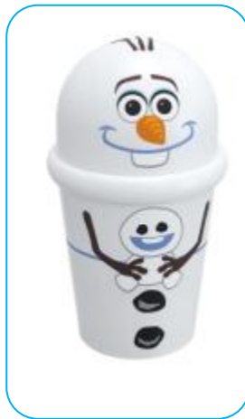
「オラフ&スノーギース」