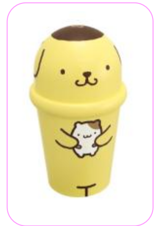
「ポムポムプリン&マフィン」