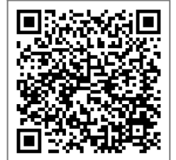
◆アプリページ 二次元コード