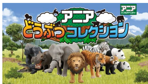
◆アプリタイトル画面