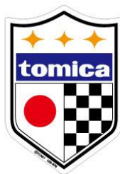
発売元: ゼネラルステッカー