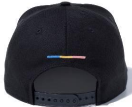
「tomica ニューエラ キャップ 9FIFTY™」 5,000円(税抜き)