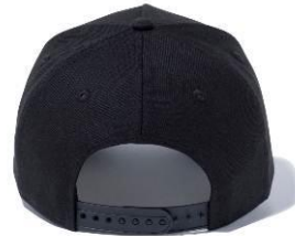
「tomica ニューエラ キャップ 9FORTY™」 3,600円(税抜き)