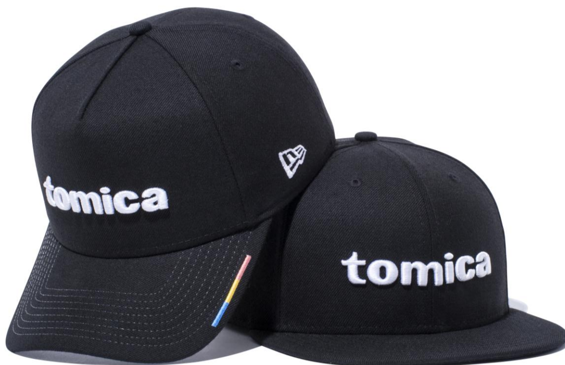
「tomica ニューエラキャップ 9FORTY™」（左）、「tomica ニューエラキャップ 9FIFTY™」（右）

2016年4月のブランド発足から、「tomica」ブランドを活用したライセンス商品は拡大しており、4つのカテゴリ（アパレル、服飾雑貨、雑貨、文具）で展開しています。これら（※一部商品のぞく）は、2017年1月13日（金）から開催される「TOKYO AUTO SALON 2017」（幕張メッセ）の「タカラトミー展示ブース」（ホール6・2階アトリウム トミカ展示ブース）で展示・販売いたします。（※ニューエラコラボキャップは先行展示のみ）