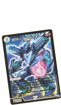
▲DMSD-01 ジョーのジョーカーズ

株式会社タカラトミー(代表取締役社長:H.G.メイ/所在地:東京都葛飾区)は、デュエル・マスターズ トレーディングカードゲーム(以下 TCG)の新シリーズ商品第一弾となる2種のスターターデッキ デュエル・マスターズTCG「DMSD-01 ジョーのジョーカーズ」「DMSD-02 キラのラビリンス」(希望小売価格:各900円/税抜き)を、2017年3月25日(土)から全国の玩具専門店、百貨店・量販店の玩具売場、カードショップ、インターネットショップ、タカラトミー公式 ショッピングサイト「タカラトミーモール」 http://takaratomy.jp/shop/ 等にて発売いたします。また、6年ぶりに主人公が代わり、2017年4月からテレビ東京系でTVアニメ「デュエル・マスターズ」の放送が決定しました。