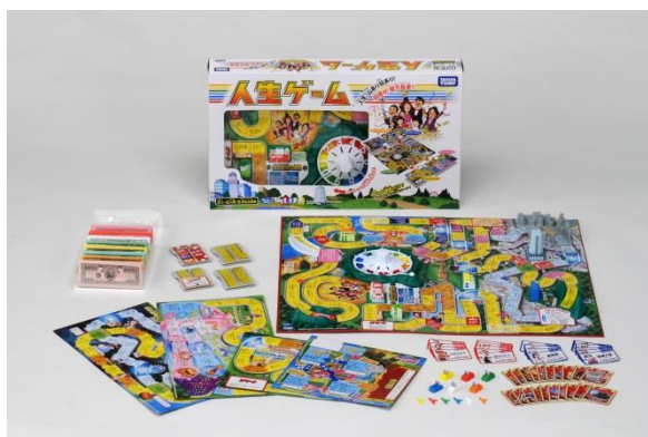
スタンダード版「人生ゲーム」7代目・2016年発売