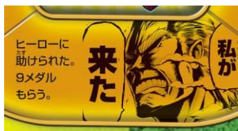
「僕のヒーローアカデミア」より