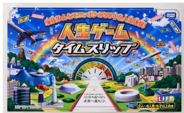
新商品「人生ゲームタイムスリップ」

また、2018年が創刊50周年となる「週刊少年ジャンプ」（株式会社集英社）とコラボレーションした「 週刊少年ジャンプ人生ゲーム 」（希望小売価格：4,500円/税抜き）を2018年7月から発売いたします。