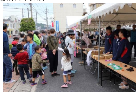
他のエリアでの過去の実施の様子