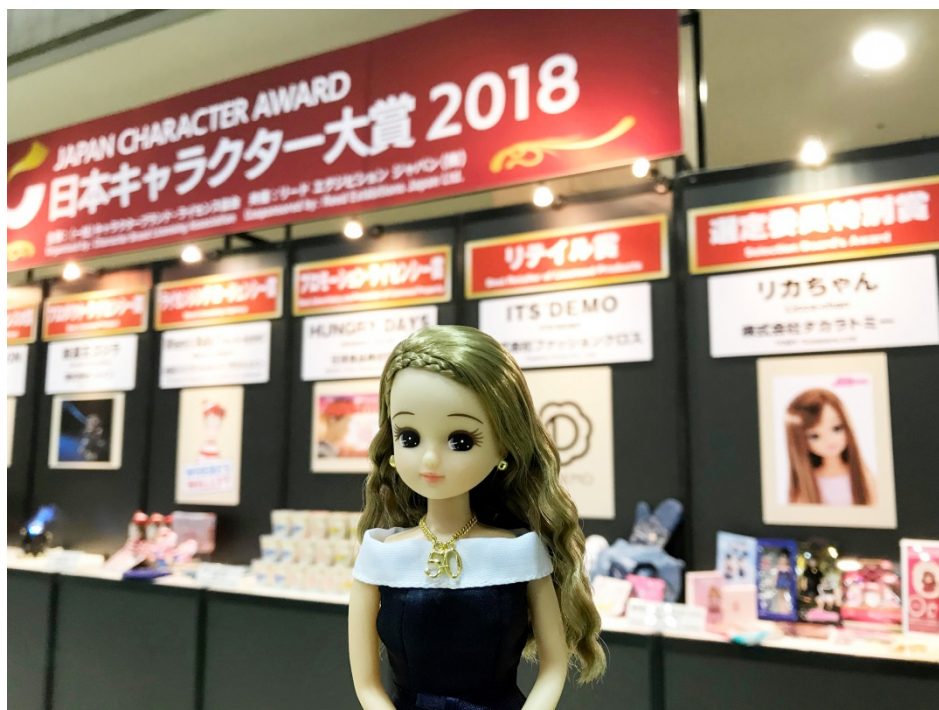
「日本キャラクター大賞 2018」表彰式会場にて

2018年の今年も、タレント名鑑にも掲載されているタレントとして「リカちゃん ラッピングバス」(葛飾区)の車内アナウンスや、コンパクトカー「NOTE e-POWER」(日産自動車株式会社)のオフィシャルモデル、アリアクリニックの広告など、数々の企業やブランドとの取り組みを実施してまいります。これからも、「リカちゃん」の活動にどうぞご期待ください。