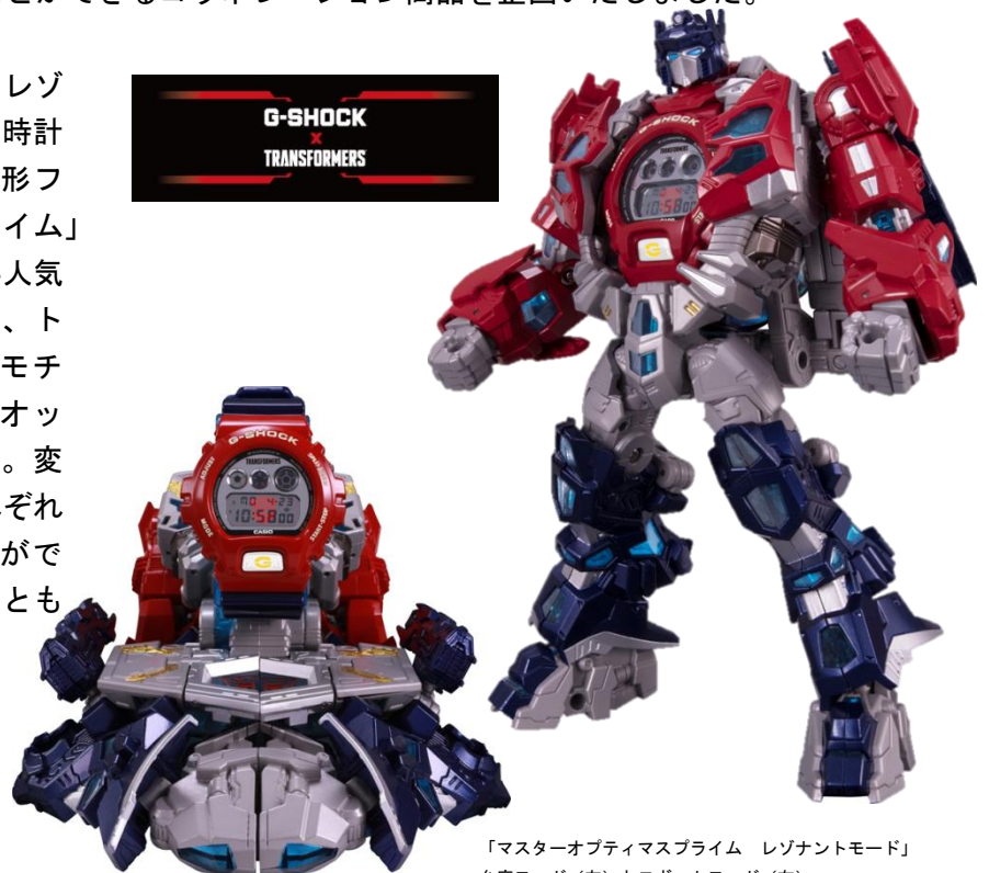
「マスターオブティマスプライム レゾナントモード」 台座モード(左)とロボットモード(右)

『マスターオブティマスプライム レゾナントモード [G-SHOCK セット]』は、時計用の台座からロボットに変形する変形フィギュア「マスターオブティマスプライム」と、「G-SHOCK」の中でも国内外で高い人気を誇るモデル「DW-6900」をベースに、トランスフォーマーのカラーリングやモチーフを取り入れてデザインされたウオッチ「DW-6900TF-4」のセット商品です。変形フィギュアは、台座・ロボットそれぞれの状態にウオッチを装着させることができるほか、装着したまま変形させることも可能です。