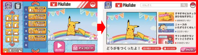
【アニメせいさく】……動画を作りパッド内の“Pika Tube”にアップ！

ピカチュウやイーブイが、どう動いたらモンスターボールをゲットできるか、ルートを考え、動きを指示するコマンドを並べます。ゲーム感覚で楽しみながらプログラミングの基礎を学習できます。