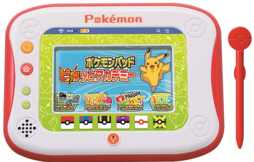
「ポケモンパッド ピカッとアカデミー」 （希望小売価格：15,000円/税抜き）