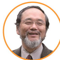
東京大学名誉教授