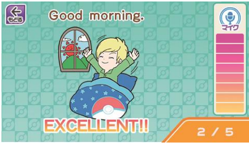
【はつおんレッスン】

英単語や世界の国々の特徴など、グローバルな知識を育むメニューを搭載しています。マイクを使った学習で、遊んでいる間に表現力を身に付けることができます。