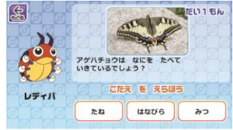
【サイエンスクイズ】