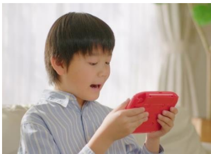
【使用イメージ】マイク機能を搭載し、英語の発音などの表現力が楽しく身に付きます。

また、判定機能付きのマイクを搭載し、お手本の真似をして英語の発音を練習する「英語発音レッスン」や、キャラクターになりきって音読する「アフレコ」など、子どもが何度も繰り返し声に出したくなる、判定付きの音声学習メニューで、表現する力を鍛えます。