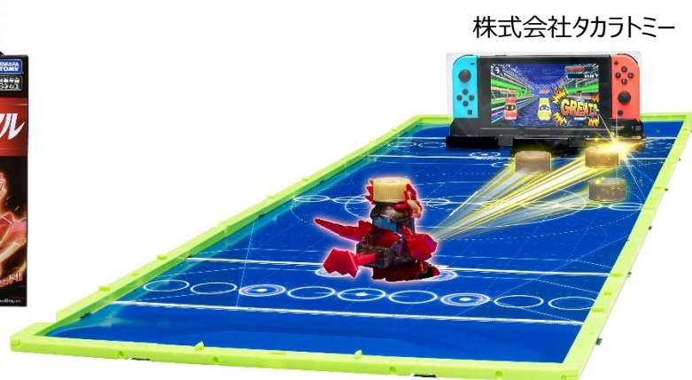
Nintendo Switch™と連動する『BOT-04 ボトルマン デジタル対戦セット』