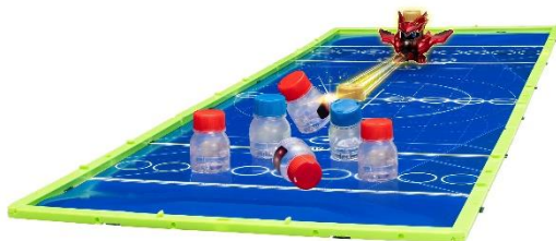
「ボウリング」(個人競技)