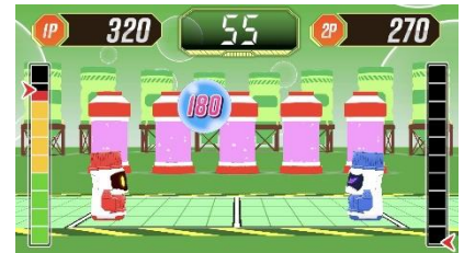
「ボトミントン」(2人用)