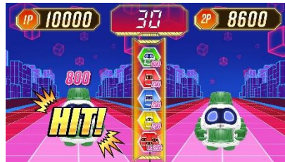
「スコアアタック」(2人用)