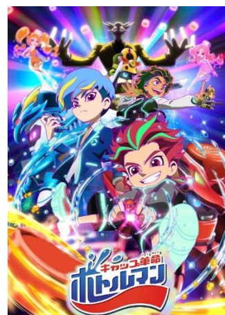
アニメ『キャップ革命 ボトルマン』もスタート！

玩具、ゲーム、アニメと子どもの大好きが詰まった『キャップ革命 ボトルマン』で、思いっきりお家時間をお楽しみください。