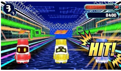
「ドリンクエスト」(1人用)

(※3) 2人で遊ぶ際は Nintendo Switch の Joy-Con を外し、Joy-Con スタンドにセットし、②と同様に Joy-Con スタンドに向かって、弾(キャップ)を打ちます。Nintendo Switch Lite でも遊べますが、2人で遊ぶ場合は Joy-Con(L)/(R)が別途必要となります。