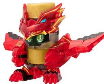
付属する「限定カラーのコーラル」