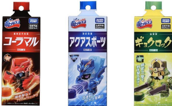
左から『BOT-01 コーラル』 / 『BOT-02 アクアスポーツ』 / 『BOT-03 ギョクロック』の商品パッケージ