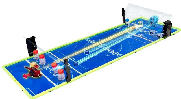
「ターゲットシューティング」(対戦競技)