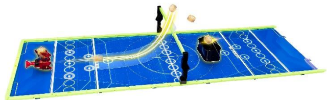
「バスケット」(個人競技)