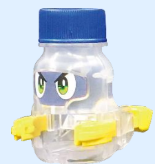
ボトルマン プロトタイプ

▶ 9月15日(火)からタカラトミーチャンネルにて配信の「ベイブレード」「ZOIDS」との特番でも本キャンペーンの内容を紹介します。