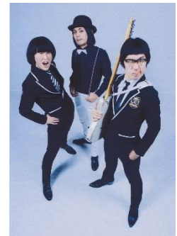
ザ 50 回転ズ