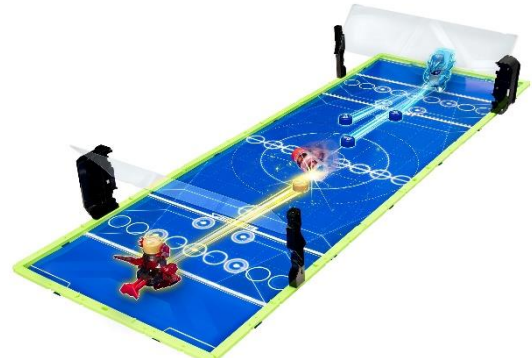
「プッシュボトル」(対戦競技)