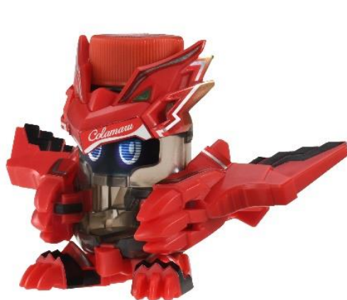
主人公機『BOT-01 コーラル』

タカラトミー公式 YouTube チャンネルにてオリジナルアニメも2020年10月9日（金）からスタート！