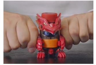
後ろ側にあるトリガーを押し込み発射！

3種の機体『BOT-01 コーラマル』、『BOT-02 アクアスポーツ』、『BOT-03 ギョクロック』は、ペットボトルキャップを本体にセットし、後ろ側にあるトリガー（バー）を押し込み発射することで、射的やバトルを楽しむことができます。パワー・スピード・コントロールの3つの射撃タイプがあり、1機種1能力を搭載。子どもが大好きな発射の爽快感が味わえるほか、それぞれ飲料をモチーフにし、コミカルかつ小学生が格好良いと思えるデザインになっています。