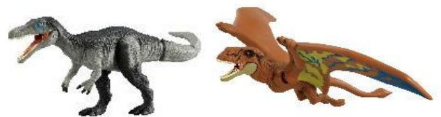
【パッケージ変更商品例 ※2】