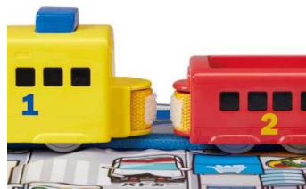
「ぷっしゅでゴー！かんたんはじめてプラレール」 連結部分(面ファスナー)

車両の連結部には面ファスナーを使用しているため、連結部分を押し付けるだけで連結ができます。(多くのプラレールの連結部分には、リングとフックの連結部品を使用しています)