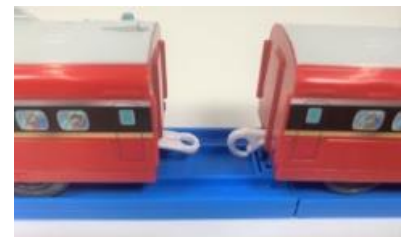
多くのプラレールの連結部分。 リングとフックの連結部品を用いている。