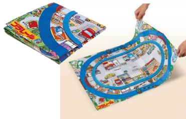
「ぷっしゅでゴー！かんたんはじめてプラレール」 レールが縫い付けられた布製マップ

プラレールで遊ぶにあたり、最初のハードルである「レールを組み立てる」ことを、レール組み立て不要の布製マップにより省略いたしました。マップには予め布製のレールが縫い付けられており、平らな場所に広げるだけですぐに準備が完了します。また、片付けの際もマップを畳むだけのため、お子さまだけでも簡単にお片付けができます。