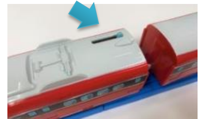
通常のプラレール ON/OFF スイッチ