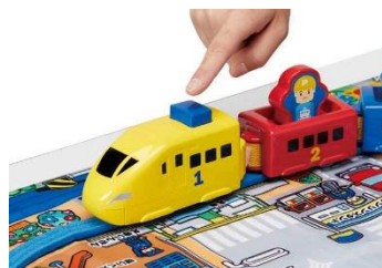
「ぷっしゅでゴー！かんたんはじめてプラレール」 のスイッチ

車両の天井部のボタンを押すと発車(または停車)します。押しやすい大きなボタンのため、より小さなお子さまでも操作しやすい仕様です。車両は電動走行だけでなく、手ころがしでも遊べます。