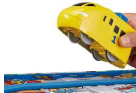
「ぷっしゅでゴー！かんたんはじめてプラレール」 マップに予め縫い付けられているレール

マップに縫い付けられたレールは布でできており、車両の車輪がレールをまたぐように乗せます。通常のプラスチックのレールでは車輪がうまく溝に合うように乗せる必要がありましたが、この商品ではそれが不要のため、小さなお子さまでも簡単にレールの上に車両をセットすることができます。