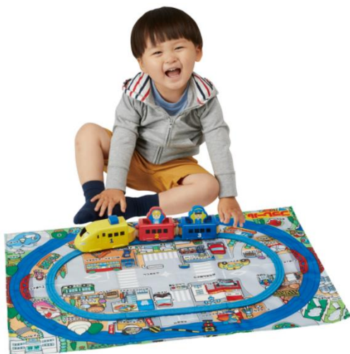
「ぷっしゅでゴー！かんたんはじめてプラレール カラフルとつきゅうセット」

株式会社タカラトミー(代表取締役社長:小島一洋/所在地:東京都葛飾区)は、鉄道玩具「プラレール」の新シリーズとして、1.5歳から遊べる電動走行プラレール「ぷっしゅでゴー！かんたんはじめてプラレール」シリーズを新たに展開してまいります。第一弾として「ぷっしゅでゴー！かんたんはじめてプラレール カラフルとつきゅうセット」と「ぷっしゅでゴー！かんたんはじめてプラレール きかんしゃトーマスセット」(希望小売価格:各5,500円/税込)を、2021年10月21日(木)から全国の玩具専門店、百貨店・量販店の玩具売場、インターネットショップ、プラレール専門店「プラレールショップ」、タカラトミー公式ショッピングサイト「タカラトミーモール」( takaratomymall.jp )等にて発売いたします。