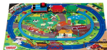
「ぷっしゅでゴー！かんたんはじめてプラレール きかんしゃトーマスセット」

本シリーズはプラレールの基本である「 レールの上を電動走行する遊び 」を、 1.5歳から楽しんでいただくことをコンセプトに開発したもので 、レール付きの布製マップと車両がセットになっています。