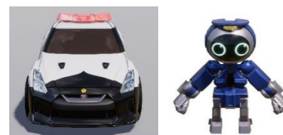
働く乗り物（パトカー）