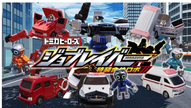
WEB アニメ「トミカヒーローズ ジョブレイバー 特装合体ロボ」 キービジュアル