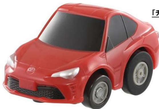
「チョコQ」 e-3 トヨタ トヨタ 86(ZN6)

株式会社タカラトミー（代表取締役社長：小島一洋／所在地：東京都葛飾区）は、モータープルバックに進化したデフォルメミニカー「チョコQ」（8種/希望小売価格：各1,699円/税込）を2022年夏から全国の玩具専門店、百貨店・量販店等の玩具売り場、インターネットショップ、タカラトミー公式ショッピングサイト「タカラトミーモール」( takaratomymall.jp )等にて発売します。また、遊びの幅が広がる「スマートQコントローラー プレイセット」（希望小売価格：1,500円/税込）を同時発売します。