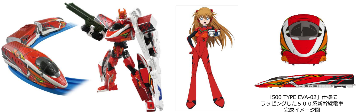
プラレール「新幹線変形ロボ シンカリオンZ シンカリオンZ 500 TYPE EVA-02」とアスカの運転士ビジュアル

また「シンカリオンZ 500 TYPE EVA-02」の登場を記念して、京都鉄道博物館(館長：前田昌裕/所在地：京都府京都市)では、2022年10月28日(金)から「500 TYPE EVA-02」仕様にラッピングした500系新幹線電車が期間限定で登場いたします。実物の500系新幹線電車(全長約27m)が、「500 TYPE EVA-02」仕様にラッピングされた迫力ある姿は、鉄道ファンのみならず、『エヴァンゲリオン』シリーズのファンの皆様にもお楽しみいただけます。