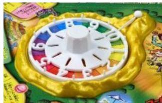
金色のルーレット