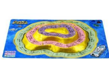
ゴールデンアイランド