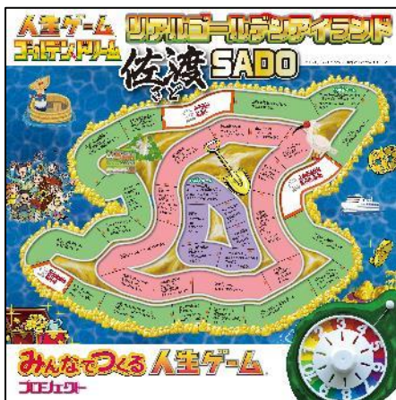
完成した「佐渡島コース」