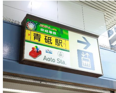
青砥駅の駅名看板の例