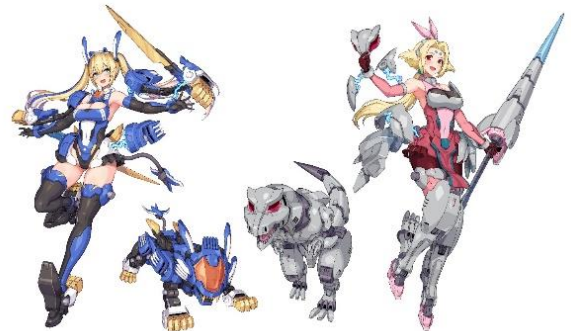
「メタモルバース」イメージイラスト