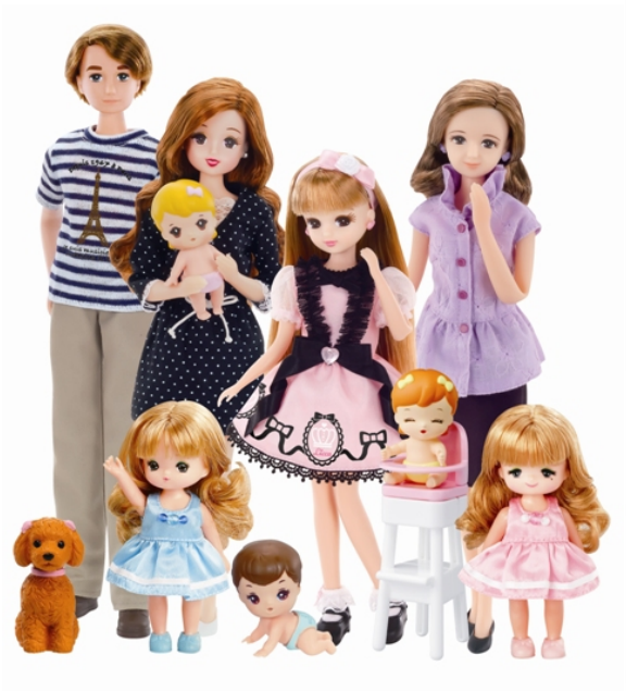
リカちゃんファミリー

名前 : 香山洋子(かやま ようこ) 誕生日 : 10月10日 星座 : てんびん座 年齢 : 56歳 趣味 : 料理・お菓子作り 好きな花 : バラ 職業 : 「ロイヤルローズ」という名のお花屋さん&カフェのオーナー