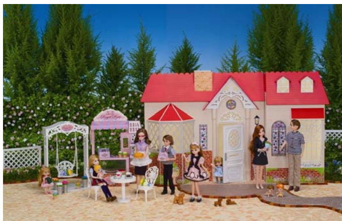
（右）「リカちゃんハウス グランドドリーム」 （左）「お花がいっぱいケーキ屋さん」*人形は別売り

1967年（昭和42年）の誕生から今年で45年、「リカちゃん」は常に時代や流行を反映しながら、少女たちの憧れや夢の暮らしを形にした商品を発売してまいりました。ファッションや職業のほか、家族もその時代を表現しています。1969年（昭和44年）に登場したママ（織江）はファッションデザイナーという時代の先端を行くビジネスウーマンでした。一方パパ（ピエール/フランス人）は、しばらく不在でしたが、20年後の1989年（平成元年）に発売となりました。これは、高度成長期、モーレツに働く日本の父親像から、週休二日制の導入なども相まって「マイホームパパ」が登場したことが背景にありました。