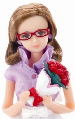
「だいすきなおばあちゃん」

株式会社タカラトミー（東京都葛飾区／代表取締役社長：富山幹太郎）は、着せ替え人形「リカちゃん」の2012年度のテーマを「家族」として展開してまいります。その新商品第一弾として、ファミリー人形「だいすきなおばあちゃん」（希望小売価格：3,360円/税込）と、立体型のリカちゃんハウスの中では歴代で一番大きい“おばあちゃんの家”「リカちゃんハウス グランドドリーム」（希望小売価格：10,500円/税込）、そのおうちに隣接する“おばあちゃんのお店”「お花がいっぱいケーキ屋さん」（希望小売価格：3,990円/税込）を、2012年4月26日（木）から全国の玩具専門店・百貨店・量販店等の玩具売場等で発売致します。