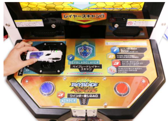
ベイロガーをかざすと勝敗に応じたポイントが貯まります

タカラトミーは、日本で古くから遊ばれ良質な文化として伝承されてきた「ベーゴマ」に、最新技術を取り入れ「ベイブレード」を展開してきました。自分のコマによって“今”目の前で繰り広げられるバトルがベイブレードのもつ最も大きな魅力です。最新作「ベイブレードバースト」では、バーストギミックによりさらに競技性が増したことに加え、最新技術のNFCチップやクラウドシステムを取り入れたことで、これまでにない遊びの価値を創造することができました。勝った負けたの喜びや悔しさ、本気で勝負するからこそ生まれるコミュニケーションは万国共通であり、その経験を通して子どもたち自身も成長していきます。ベイブレードが持つこうした魅力をさらに広げ、文化・言語・国境を越え世界中の子どもたちをつなぐ一つの共通言語となることを目指して「ベイブレードバースト」を展開してまいります。