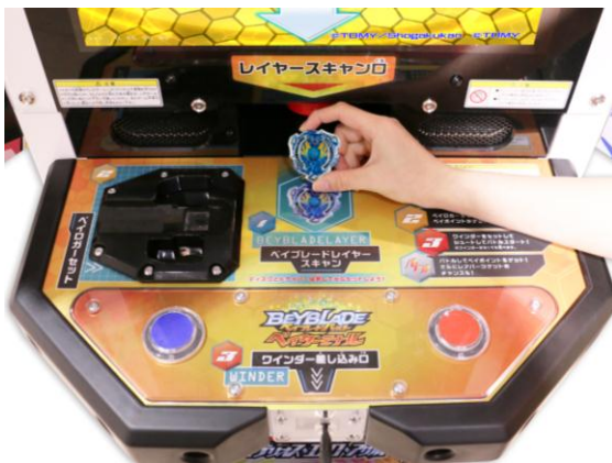
レイヤーを筐体にスキャン